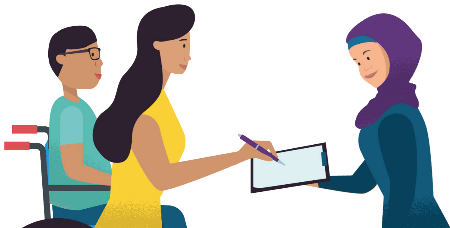
> Zus van Marcel neemt de beslissing over de zorg

Als iemand wilsonbekwaam is, neemt zijn wettelijk vertegenwoordiger de beslissing over de zorg. Bijvoorbeeld een mentor, partner, ouder, broer of zus.