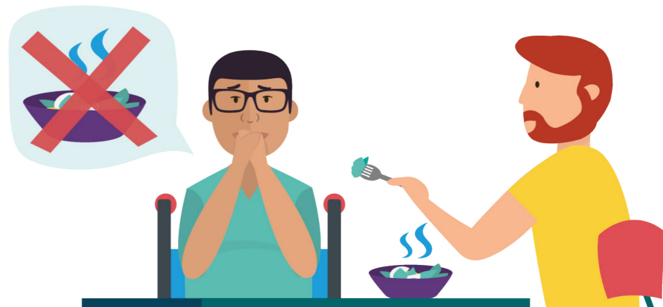
> Voorbeeld van onvrijwillige zorg